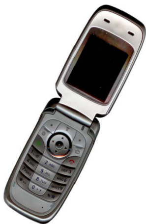
Gbr. 2 Contoh gambar dengan resolusi cukup