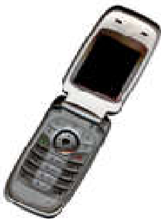
Gbr. 1 Contoh gambar dengan resolusi kurang